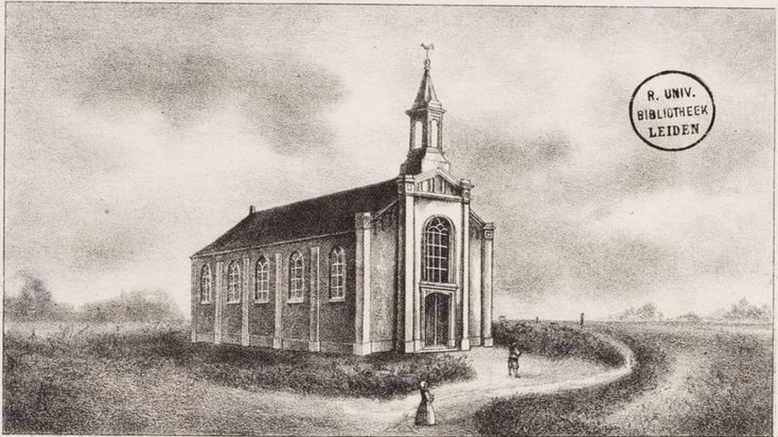
KERK IN HET HELENA VEEN. bijl. 1

GUSTAAF-ADOLF, 1870, p. 132 Helenaveen door P. H. TESTAS.