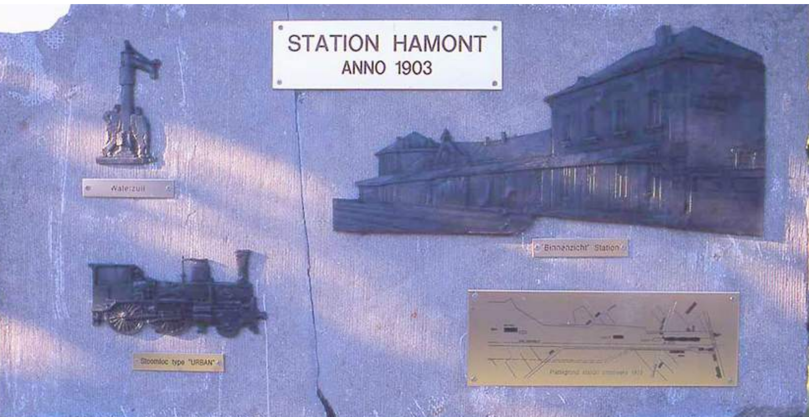
[plaquette van het station te Hamont in 1903.]