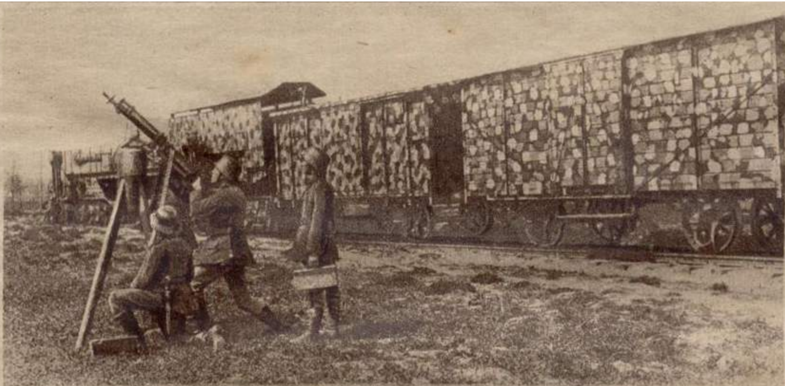
[Katholieke Illustratie 10 oktober 1918: HOE MEN TREINEN MASKEERT. ]

100 In Hamont stonden op 18 november 1918 een grote hoeveelheid treinen, naast en achter elkaar mogen we aannemen. In 1903 waren er 60 sporen en 90 wissels op het emplacement, en het is aannemelijk te denken dat de Duitsers het emplacement tijdens de oorlog flink hebben uitgebreid en gemoderniseerd, hoewel er niet zoveel treinverkeer met Budel zal zijn geweest vanwege de afsluiting van de grens. 105 De gebeurtenissen van die nacht van 18 tot 19 november 1918 zijn te reconstrueren aan de hand van verslagen in de kranten. Vaak wordt verwezen naar de Meijerijsche Courant die 's ochtends vroeg een eigen redacteur naar Hamont stuurt. Ook het Eindhovens 110 Dagblad gaf informatie uit de eerste hand. Enige gebeurtenissen voor en na de 18-de en 19-de november zijn ook van belang voor het begrip.