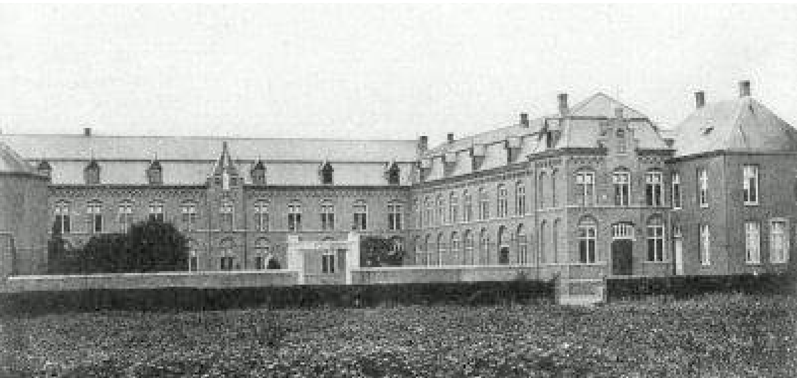
[klooster der Ursulinen te Hamont]

Eindhoven, Budel, 19 november 1918 1.00 uur