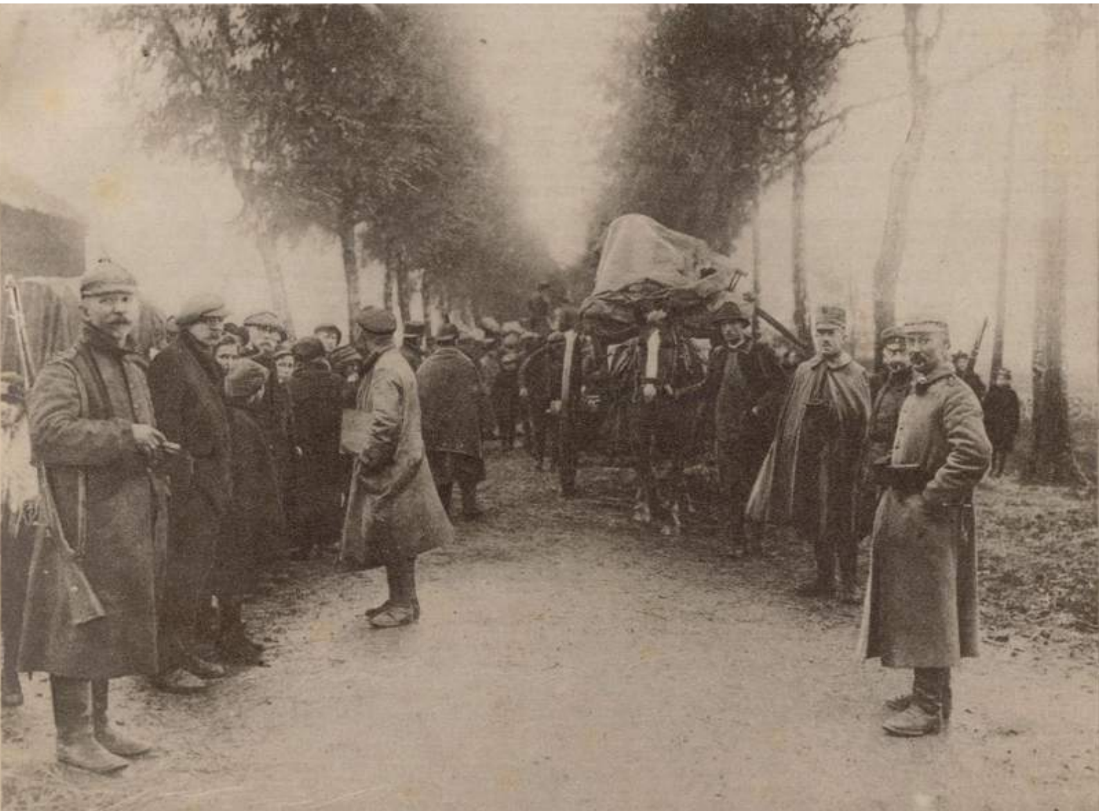
[Katholieke Illustratie 2 november 1918: SLACHTOFFERS VAN DEN OORLOG. De Nederlandse militairen helpen de vluchtelingen hun bagage overladen te Thorn.]

140 dit overduidelijk gebeurd; kinderen spelen tussen te treinen met vuurpijlen die gemakkelijk op houten delen van wagons terecht kunnen komen, genoemd wordt bijvoorbeeld een treeplank van een wagon. Al draaiende kan zo'n pijl de wagon binnenschieten. Natuurlijk kunnen de kinderen ook gericht een brandende vuurpijl in een wagon geschoten hebben.