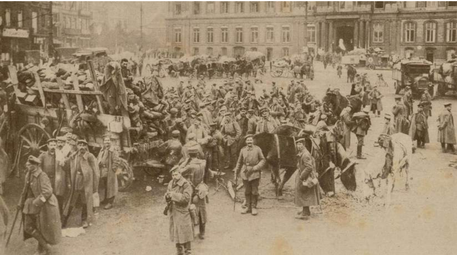
[Katholieke Illustratie 13 november 1918: Drukte bij de Kommandantur op het mooie Place St. Lambert te Luik. (de foto dateert dus van enkele dagen eerder)]