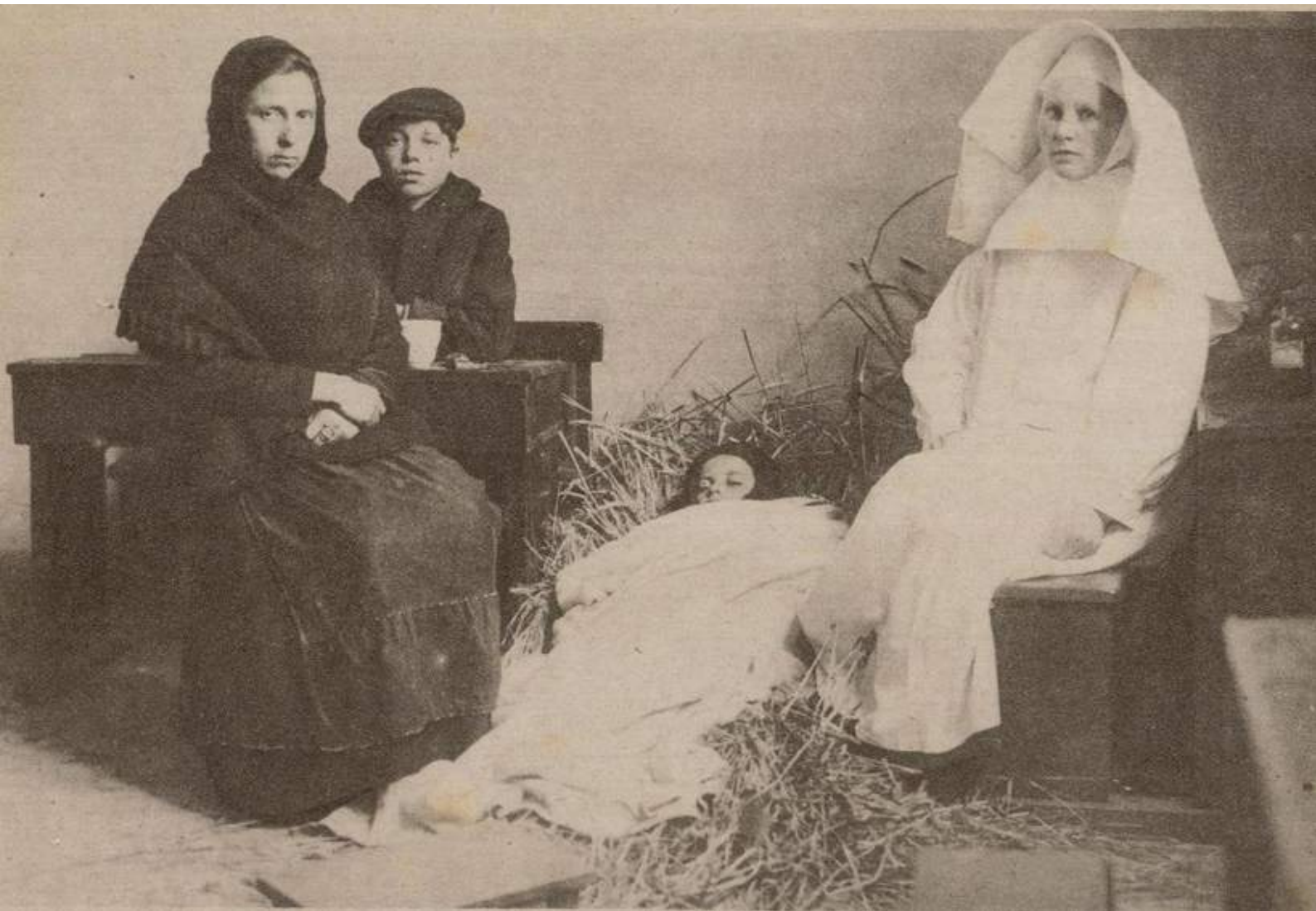
[Katholieke Illustratie 2 november 1918: VLUCHTELINGEN AN DE GRENS TE WEERT. Ongelukkigen uit Noord-Frankrijk, die hier in ons gastvrije Nederland beschutting komen zoeken tegen de verschrikkingen van den oorlog. Een liefdezuster bij een stervend kind. De moeder, wier man aan het front gesneuveld is, was met de arme kleinen van Douai komen loopen!]