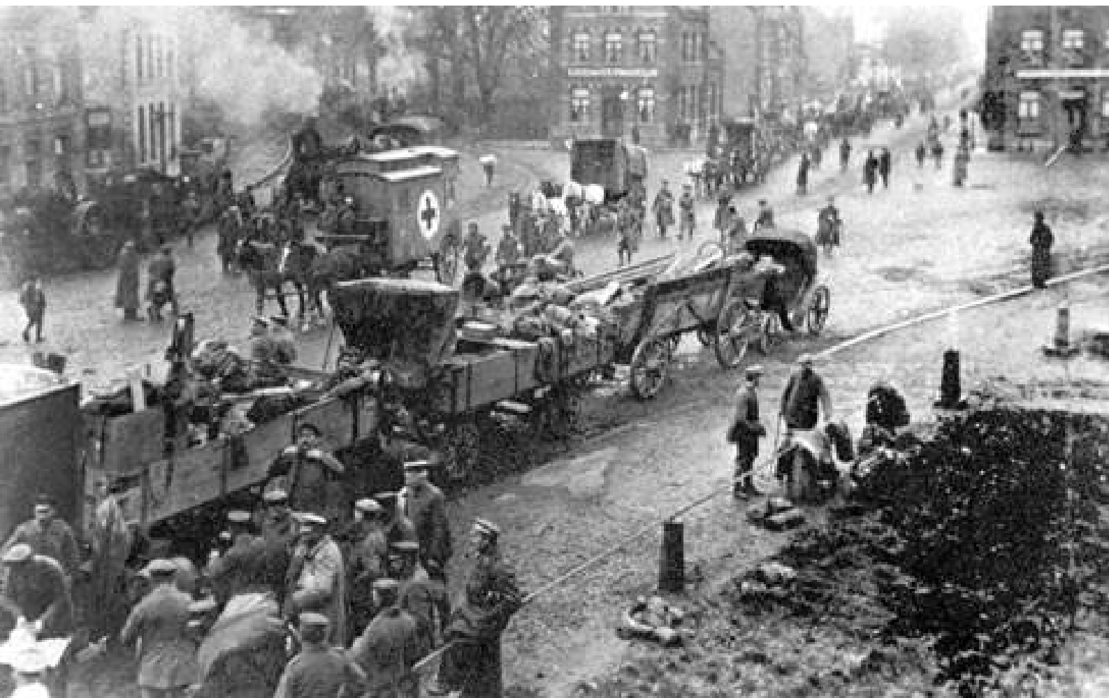
[Doortocht der Duitsers door Roermond, medio november 1918.]

55 worden door de geallieerden in beslag genomen. Munitie wordt in munitietreinen vervoerd, de gewonden met zogenaamde lazarettreinen, paarden met veewagens. Maar er bestaan ook keukenwagens en open kolenwagens naast de gesloten goederenwagens. Er waren zelfs treinen met ongeveer 70 wagons die door drie locomotieven getrokken 60 werden en het "tempo was verbazend langzaam".