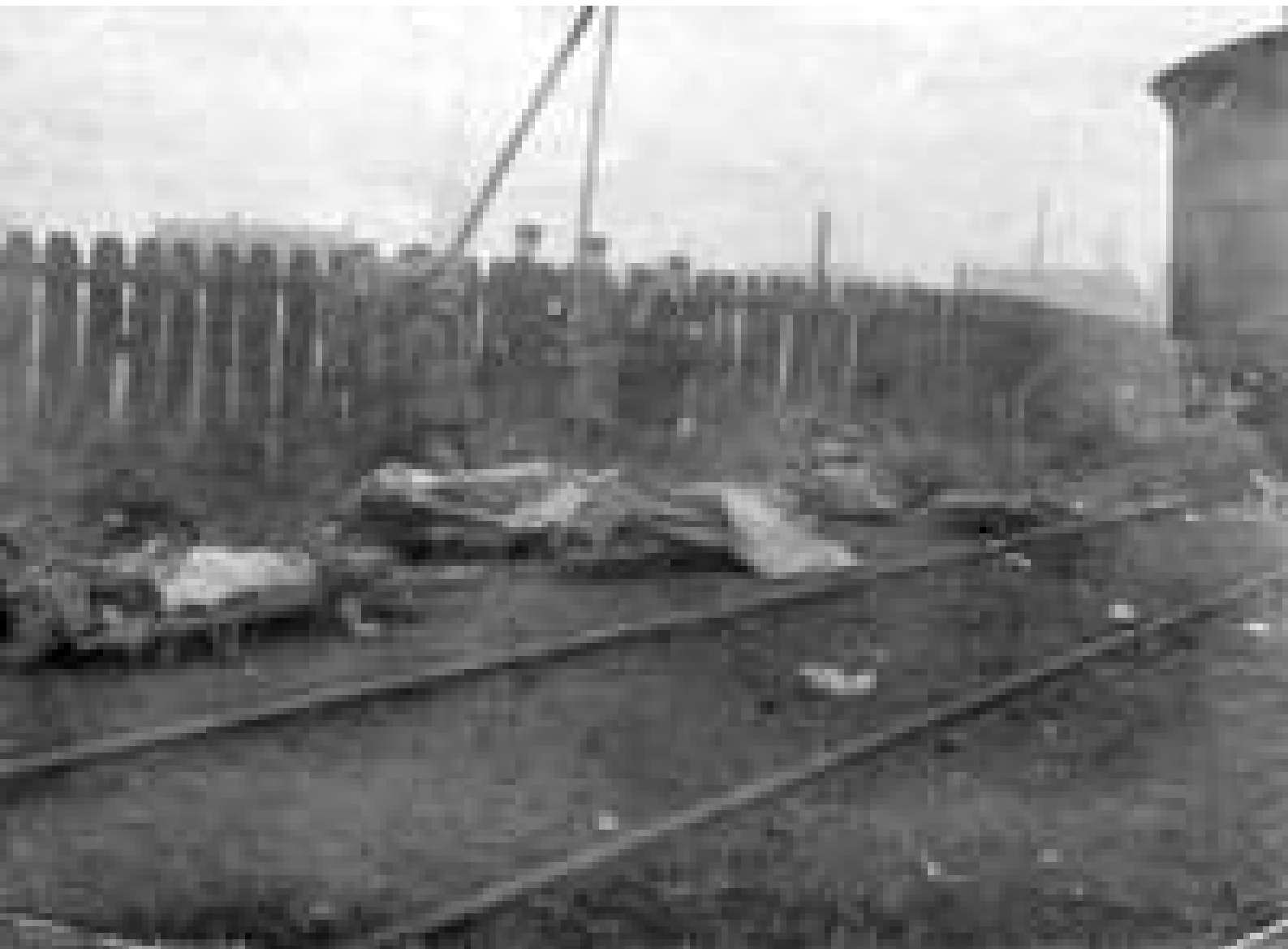
[look op deze foto de molen op de achtergrond]