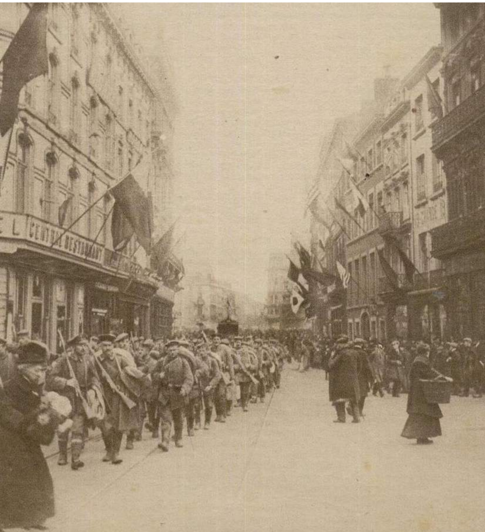
[Katholieke Illustratie 13 november 1918: HET VERTREK DER DUITSCHERS UIT LUIK. In een der hoofdstraten van Luik: van de gevels der huizen wapperen de vlaggen der geallieerde landen (de foto dateert dus van enkele dagen eerder)]