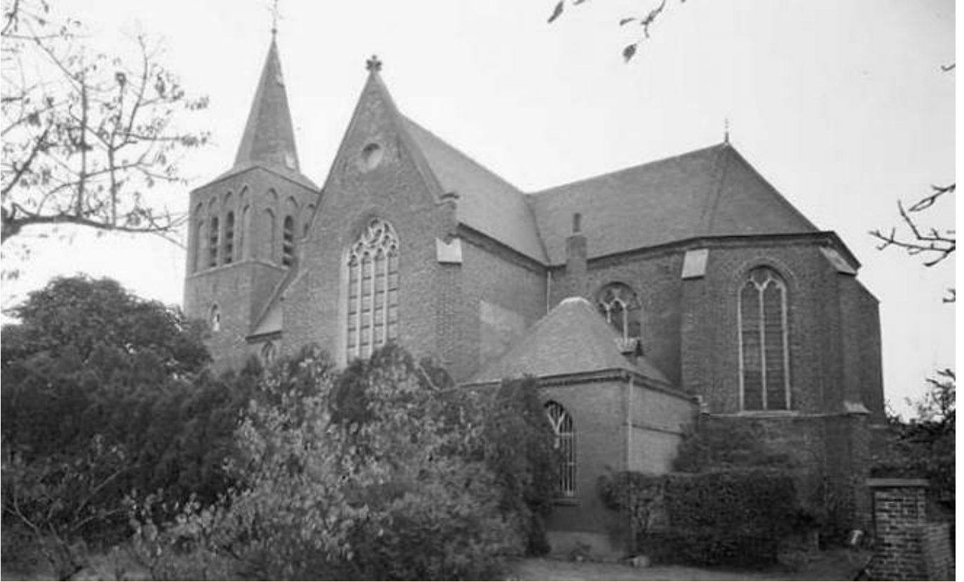
De Clemenskerk in Gerwen, gefotografeerd in oktober 1959