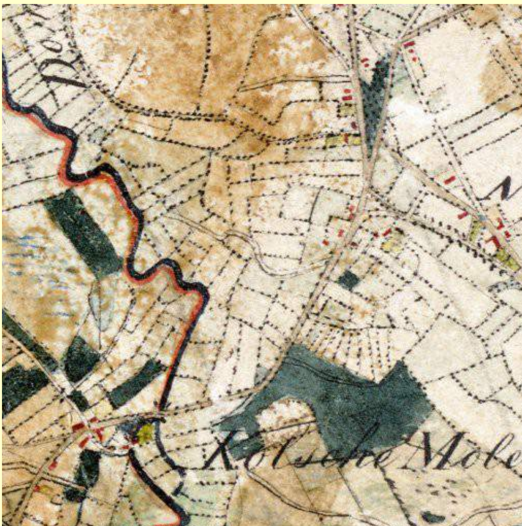
[Detail van de Militaire topografische kaart (veldminuut) van 1840.]