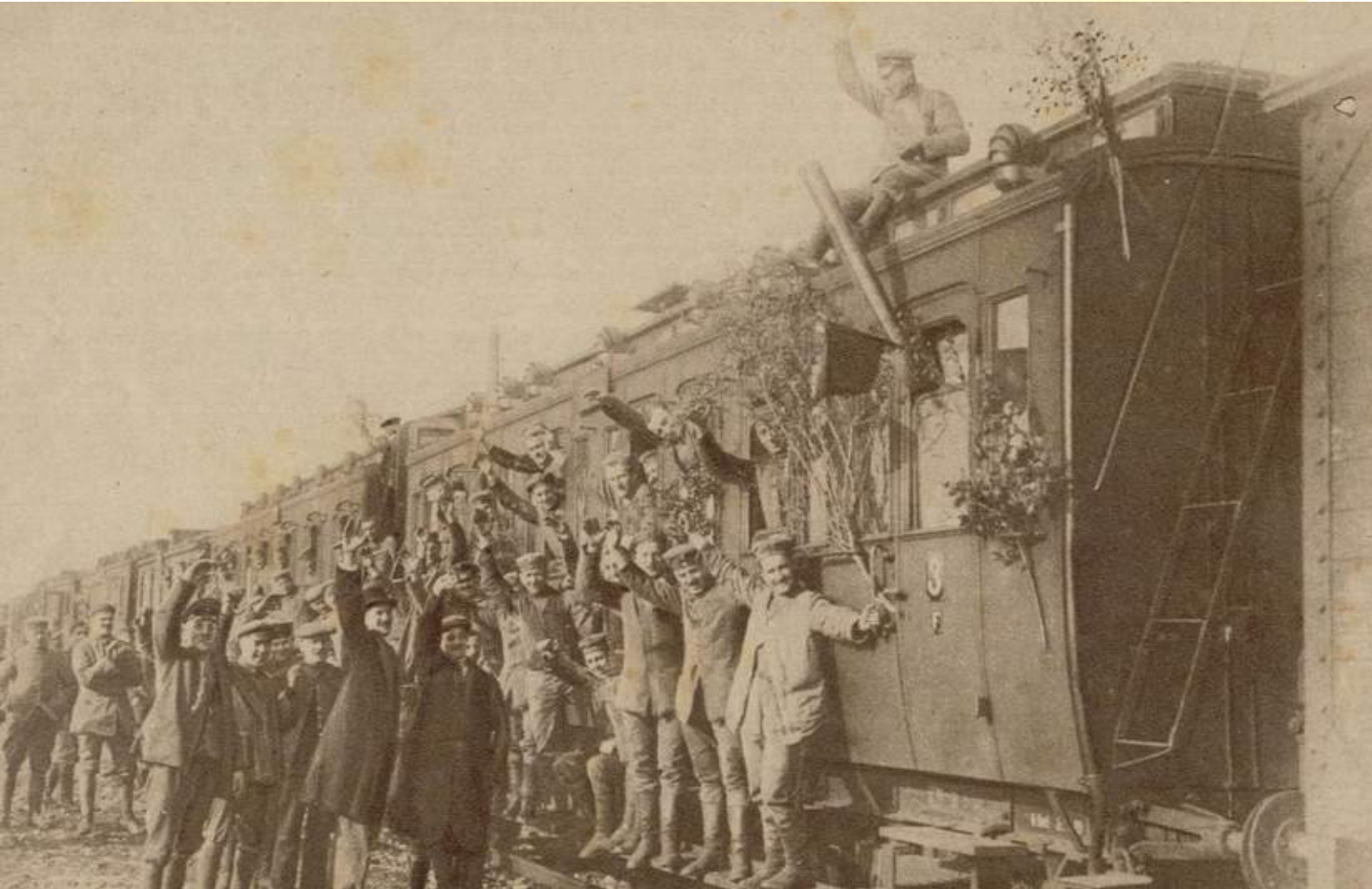
[Katholieke Illustratie 13 november 1918: HET ENTHOUSIASME BIJ HET VERTREK UIT VISÉ. (de foto dateert dus van enkele dagen eerder)]